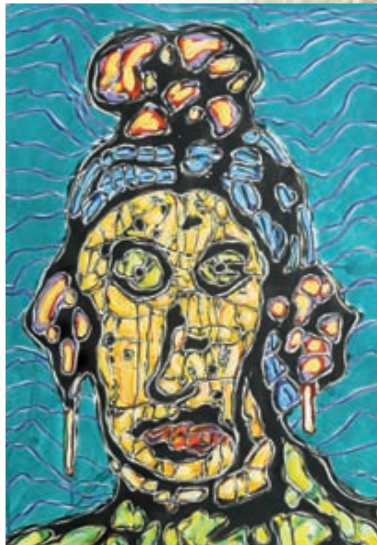
Carmencita Acrylique et cire sur papier