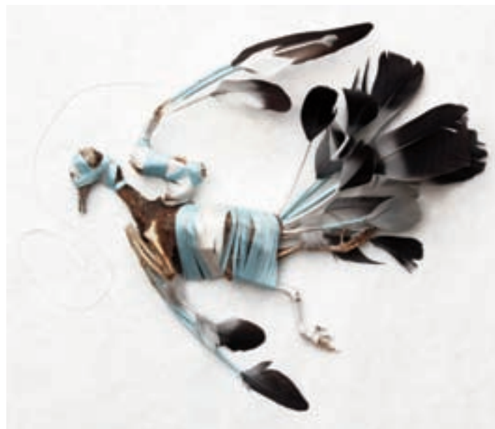
Nœuds de flèches 14

Dans cette installation, Julien Salaud expose les moyens mis en œuvre pour réaliser ce tableau. Il se compose d'un ensemble de mobiles ou d'accrochages de pigeons momifiés disposés autour de la photographie d'un pigeonier, d'une table sur laquelle sont disposés le matériel du tisseur et la vidéo diffusée en boucle des gestes opérés par l'artiste. A travers cette disposition d'un atelier, il en espère un prolongement. L'artiste emmaillote, enroule de fils soyeux blanc et bleu, les dépouilles desséchées de pigeons trouvés dans le grenier d'un immeuble. Evoquant le rite funéraire de momification des égyptiens, l'artiste en rappelle la fonction : « la momification des hommes ou des animaux était un rituel pour la survivance de l'âme au corps (...) ». De ses gestes répétés de la boucle et du nouage, il panse et recompose l'animal démantelé pour offrir un nouveau genre de nature morte en trois dimensions. Il file la métaphore en nous renvoyant à notre propre expérience : « La mort des animaux est-elle différente de la nôtre ? (...) Comment devons-nous traiter les cadavres de ceux qui nous entourent ? ». Il semble nous alerter sur la disparition d'un rituel de passage et la nécessité de retarder une décomposition accélérée.