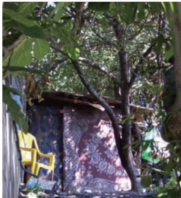
Adresse : Canal de l'Ourcq. (détail)

Cet abri de fortune, fait de bric et de broc, construction fragile, est différent des conventions de virtuosité et de pérennité attribuées habituellement aux œuvres d'art. Cet habitacle est de taille humaine et légère nous indique sa légende, tel un décor d'itinérant. Le titre "Adresse : Canal de l'Ourcq" évoque non seulement la précarité, l'anonymat mais aussi la mobilité. La sculpture s'installe, son installation réactive cette première impression mêlée de questionnements et d'émerveillements. A travers cette œuvre, l'artiste revisite la fonction première d'un abri, rend hommage à l'ingéniosité de ces gens, et à leur capacité à cultiver dignité, poésie et féerie.