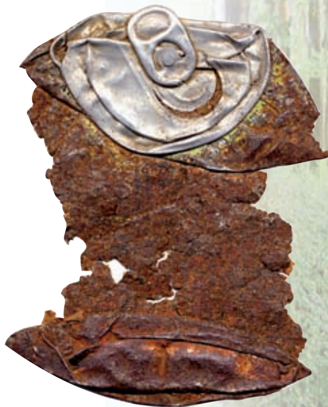
E Ø 97

Thierry Morin nous conte l'histoire d'une canette. Au cours de ses promenades urbaines, il photographie des canettes vides. Gros et très gros plans d'objets de notre consommation, ses photographies les révèlent à différents stades de leur décomposition : jetées, écrasées, rouillées ou effritées. L'artiste-photographe les isole sur un fond blanc et dresse le support pour témoigner d'une société de consommation sans scrupule. Le grain du tirage, la texture de la décomposition, l'isolement et la frontalité du motif donnent davantage de réalisme à l'image. La complainte de la canette, poème que l'artiste joint à la photographie, met l'accent sur le prolongement de ces gestes irresponsables. La canette endosse à tour de rôle celui du témoin et de victime anonyme : objet-symbole malmené de notre société.